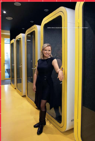
Lego má novou strategii na trhu dospělých. Chceme jim prodávat dražší stavebnice

Zároveň i Blythe a Fenty x Lego objevila díky tomu úspěšně. Chceme jim prodávat dražší stavebnice